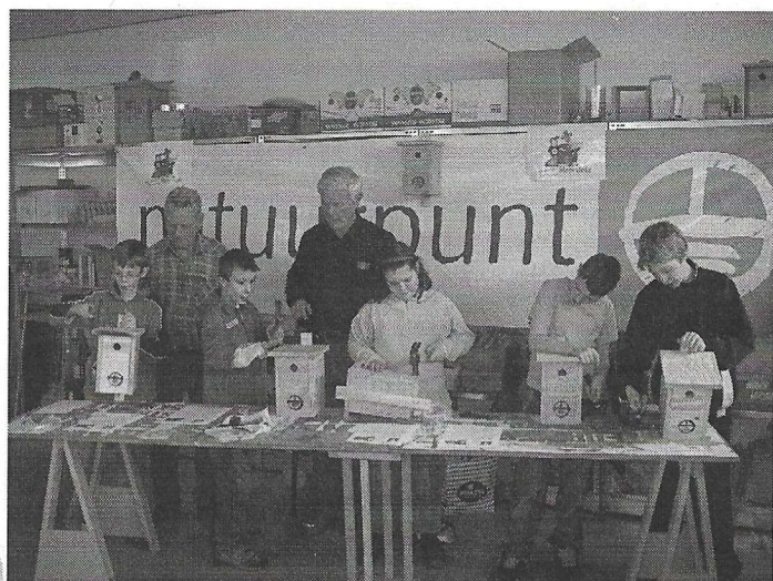
Timmeren aan de toekomst

Woensdagnamiddag 20 februari 2008 had De Reiger een 2de nestkastactie in Moorslede. Ditmaal deden we de gemeenteschool aan.