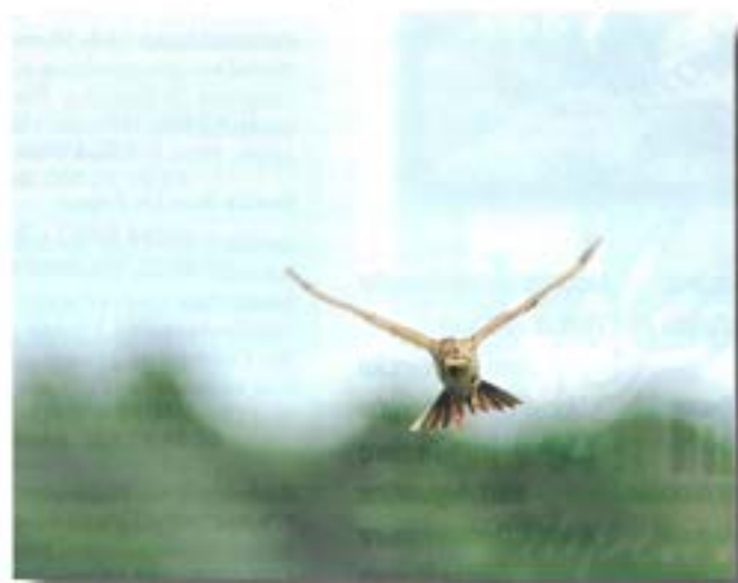
gevoelen, zou het in ieder geval niet billijker zijn om zijn leefgebied toch beter te beschermen?