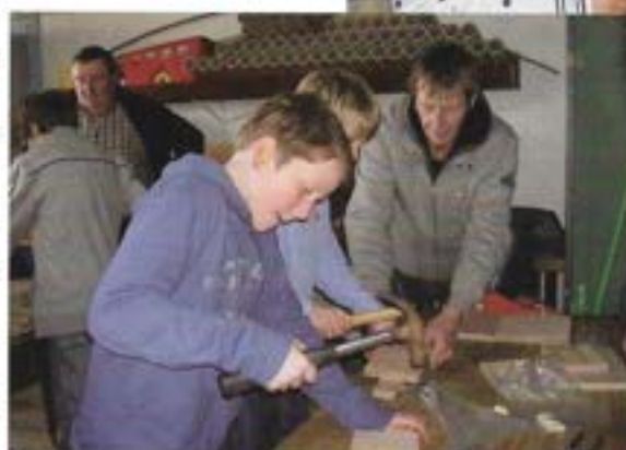
foto in 3 kranten kwamen kon die glinstering alleen maar versterken. Na nog wat extra uitleg van de begeleiders over hoe de nestkasten tegen weersinvloeden te beschermen en waar en hoe ze het beste op te hangen, togen de "timmerlui in-spe" trots naar hun klas met hun vakwerkje.

Na dit labeur werden bovenop nog 3 mooie prijzen verloot onder de kinderen. Het gratis lidmaatschap van Natuurpunt, een jaarkalender van dezelfde vereniging en een gratis nestkastpakket. Deze namiddaguren waren goed besteed. Tevreden begeleiders, een aangename actieve les voor 63 kinderen en hopelijk massa's vogels die deze nieuwe nestplaats kunnen gebruiken in dit voorjaar.