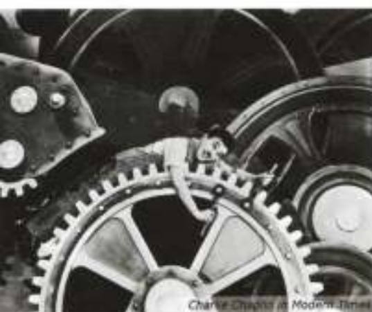
Charlie Chaplin in Modern Times

Wat kunst en design betreft werd de Eiffeltoren eind de 19de eeuw door velen ervaren als een gedrocht. Het is pas na de 'Art Nouveau' (rond 1900) dat de industriële cultuur in de vormgeving slechts gedeeltelijk doorbreekt. In het begin van