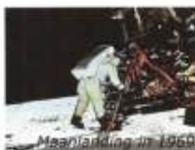
Maanlanding in 1969

Op het zelfde moment werd technologie op grote schaal toegankelijk voor de massa.