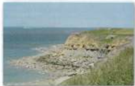
Cap Gris Nez

Over de middag zoeken we een eetgelegenheid in Wissant waar we ons lunchpakket kunnen eten en bezoeken daarna de moerassen achter de duinengordel: je krijgt er een idee hoe onze polders er tijdens de middeleeuwen kunnen uitgezien hebben. Bruine kiekendief zien we zeker.