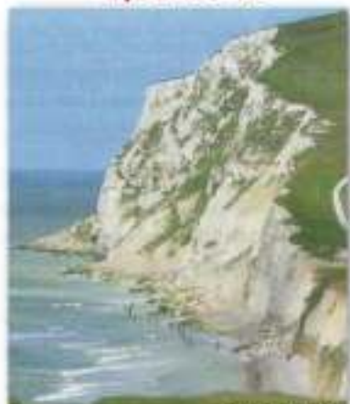
Cap Blanc Nez

De witte krijtkusten die zeer rijk zijn aan fossielen kent iedereen. Richting Calais kunnen we een ruime wandeling maken tussen gaspeldoornvegetaties en zien we uit of er reeds wat vogeltrek is. De ganse kustlijn ligt letterlijk bezaaid met bunkers, relictten van de fameuze 'Atlantic Wall': ook de vele bomtrechters zijn opmerkelijk. Ter hoogte van Escalles bereiken we het strand: misschien vind je wel fossielen van ammonieten of haaiantanden.