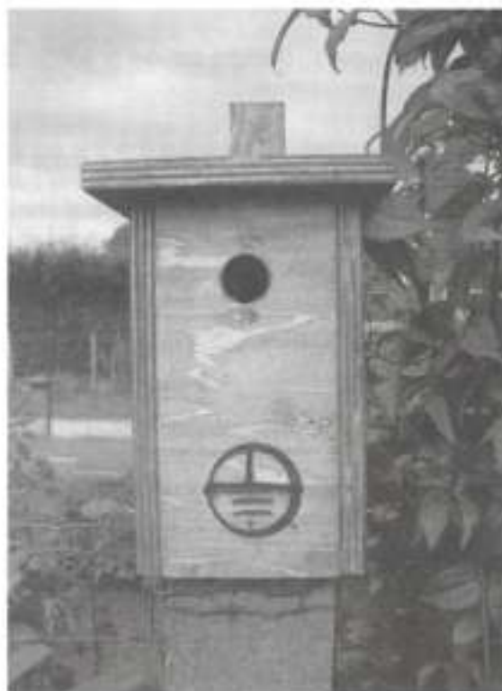
Mezen- en Ringmussennestkast