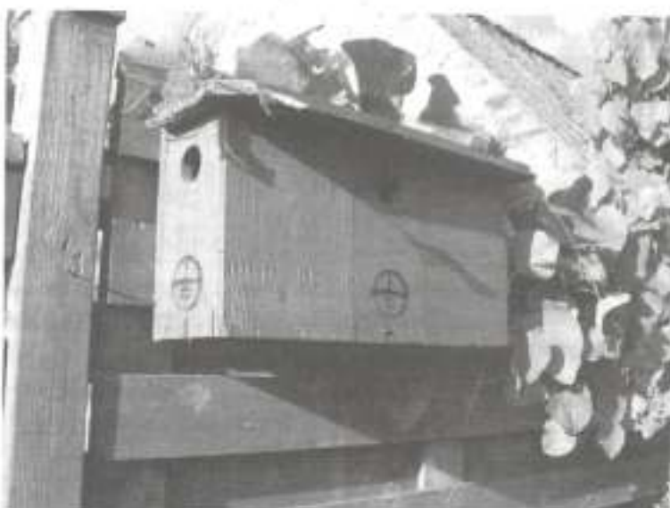
Mussenmotel voor 3 koppeltjes (alleen te verkrijgen kant en klaar) Leden Natuurpunt: €20 Niet-leden Natuurpunt: €25