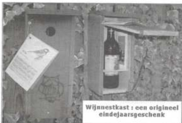
Wijnnestkast : een origineel eindejaarsgeschenk

Bestellen bij Ludo Momerency ==> 051/22 52 80 ludo.momerency@telenet.be of bij Piet Desmet ==> 051/22 58 52 ==> natuur.mandelstreke@scarlet.be