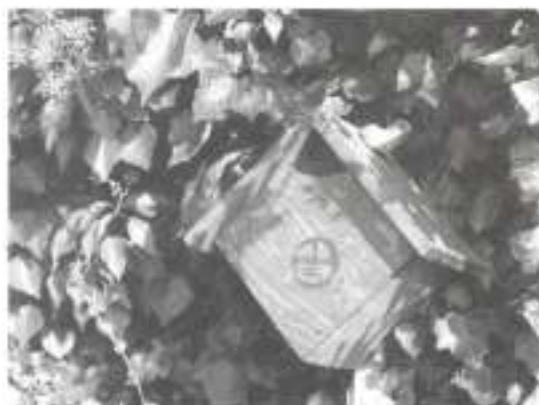
Winterkoning- en Roodborstnestkast (alleen kant en klaar)

Prijs van alle bovenstaande nestkasten bedraagt: Leden Natuurpunt : Kant en klaar €9 ; zelfbouwpakket €5 Niet-leden Natuurpunt: €10 en €6