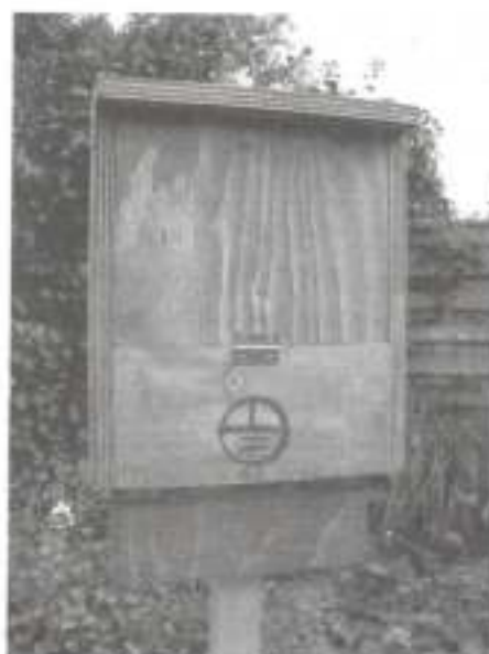
Vleermuizenkast (alleen te verkrijgen kant en klaar): Leden Natuurpunt: €12.50 Niet-leden Natuurpunt: €14