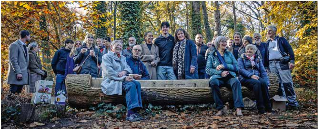
Wijlen Marcel Gevaert, oprichter van wat nu Natuurpunt Torhout én Natuurpunt Midden-West-Vlaanderen zijn, werd geëerd met een bank op zijn favoriete plekje in het Groenhovebos.

stuk natuur voor iedereen. Uit waardering voor zijn levenswerk werd, in overleg met zijn familie, een zitbank ingehuldigd in de Vrouwkeswegel, vlakbij zijn favoriete rustplek. Een warme dankjewel ook aan de familie Gevaert, die onze vrijwilligers trakteerde op een hapje en een drankje.