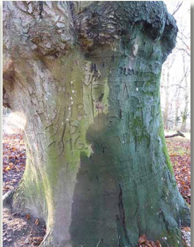
Links: deze dreefbeuk, in de dreven ten noorden van de Kasteeldreef in Hertsberge, is een telboom. Onder het 'telraam' staat ook nog een Romeins cijfer.