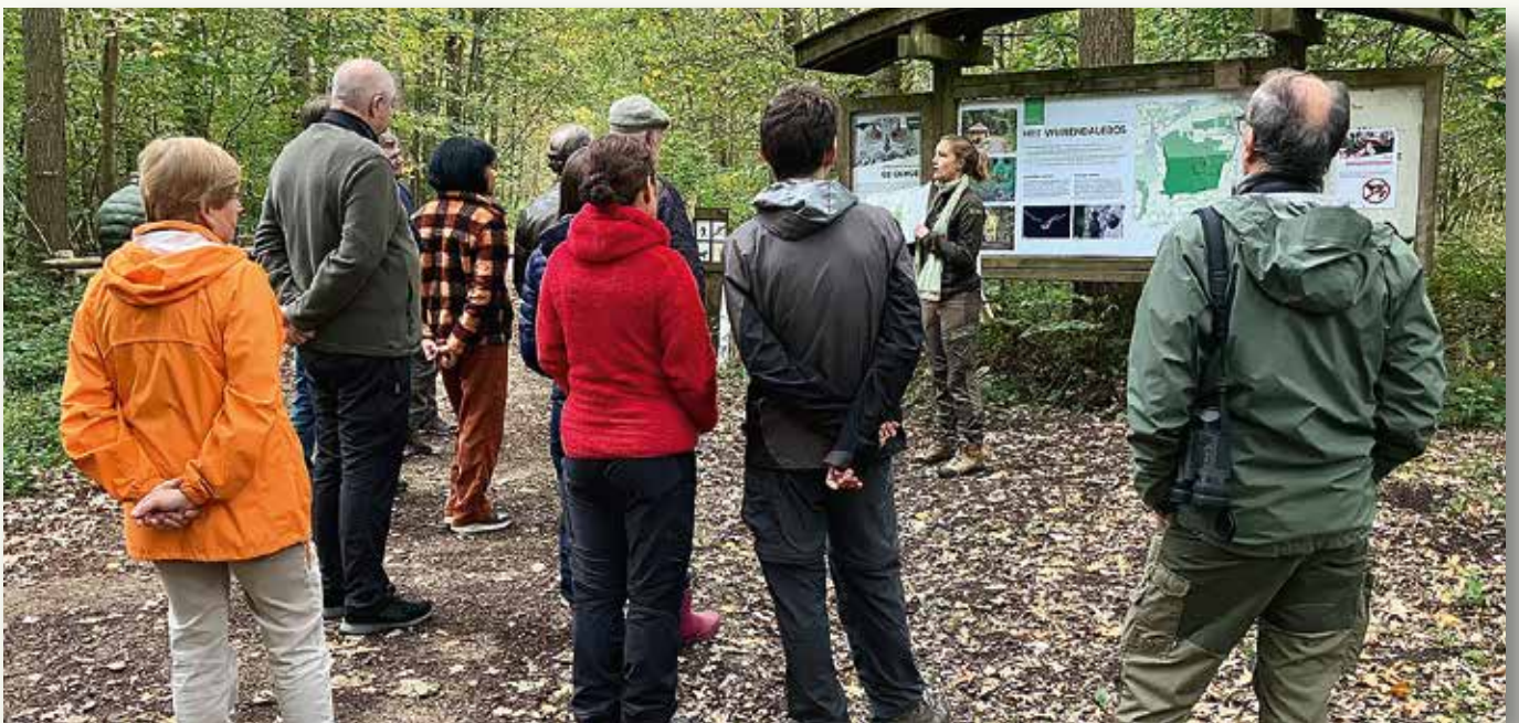
Zondag 12 oktober organiseerde het Agentschap voor Natuur en Bos een wandeling in het Wijnendalebos om meer uitleg te geven bij het nieuwe natuurbeheerplan. Met dit document worden de visie en het beheer voor de komende 24 jaar vastgelegd voor honderden hectaren bos- en natuurgebied in de regio.

In het bosreservaat, een gebied van 65 hectare dat al sinds 1984 is afgesloten, worden er allerlei wetenschappelijke onderzoeken gedaan.