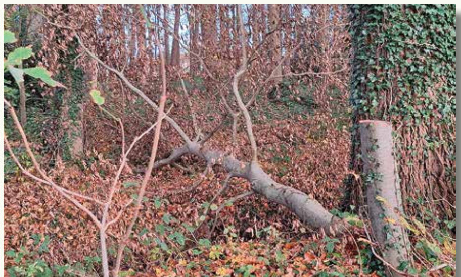
Deze gezonde beuk werd 'voor de lol?' omgelegd. Niet het eerste geval van 'ecovandalisme' in dit gebied.

In september stelden we opnieuw ecovandalisme vast in het drevengebied rond Kasteel Rosendahl. Een kerngezonde beuk ( Fagus sylvatica ) werd op een hoogte van 1 meter afgezaagd. Deze boom stond langs het Rozendaal Wandelpad, op een steenworp van de plaatsen waar in het voorjaar van 2025 stengellose sleutelbloemen ( Primula vulgaris ) en struikhei ( Calluna vulgaris ) werden uitgegraven. We dienden klacht in bij de politie en brachten de milieudienst van de gemeente en de natuurinspectie van het Agentschap voor Natuur en Bos op de hoogte.