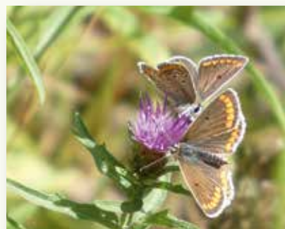
Twee bruine blauwtjes op knoopkruid. Inderdaad: bruine blauwtjes, maar dat is een verhaal voor een volgende keer. ;-)

Samengevat kunnen we stellen dat de droge en hete zomer van 2025 de dagvlinders op 'De Swal' geen goed heeft gedaan. Vooral de