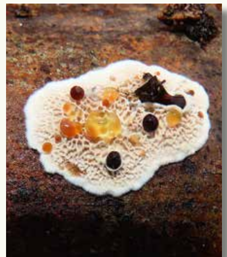
Zwetende zwammen: links teervlekkenzwam ( Ischnoderma benzoinum ), rechts wijdporiekurkzwam ( Datronia mollis ).