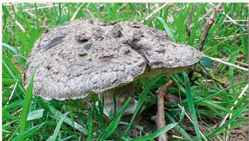
De zwarte amaniet ( Amanita inopinata ) is een hele rare paddenstoel: zo goed als zeker een exoot, maar niemand weet waar hij vandaan komt. En als enige amaniet leeft hij niet samen met bomen, maar is hij een strooiselopruimer.

De eerste Europese melding van deze soort dateert uit 1976, in Engeland. En omdat de paddenstoel met geen enkele tot dan toe bekende soort overeenkwam, werd deze in 1987 beschreven als een nieuwe soort voor de wetenschap. In 2008 werd hij voor het eerst in ons land gezien en sinds 2012 wordt hij jaarlijks gespot, meestal op slechts enkele locaties. Maar 2025 was een uitzonderlijk jaar: eind november stond de teller al op 26 kilometerhokken. Ondertussen blijft onduidelijk waar deze opvallende paddenstoel vandaan komt. Aangezien