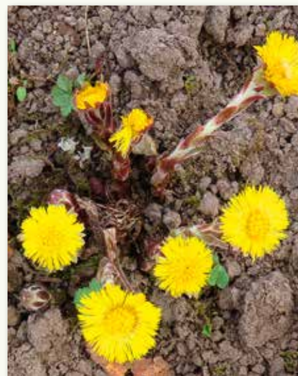
Klein hoefblad ( Tussilago farfara ) is een plant uit de composietenfamilie die erg vroeg bloeit, soms al in februari. Wat ook bijzonder is, zeker voor een composiet, is dat de bladeren pas verschijnen ná de bloei.

Als inheemse plant heeft Tussilago farfara een lange geschiedenis in de volksgeneeskunde. Al sinds de Romeinen – en wie weet nog vroeger – werd de plant bij hoest aangewend in de vorm van thee. Maar ook bij krampen, koorts, ontstekingen van de urinewegen, vermoeidheid en zenuwpijnen zou de plant helpen. Uwendig kan je de plant gebruiken op abcessen en zweren. In 1994 kreeg het Klein hoefblad in Duitsland nog de titel "Artsenijplant