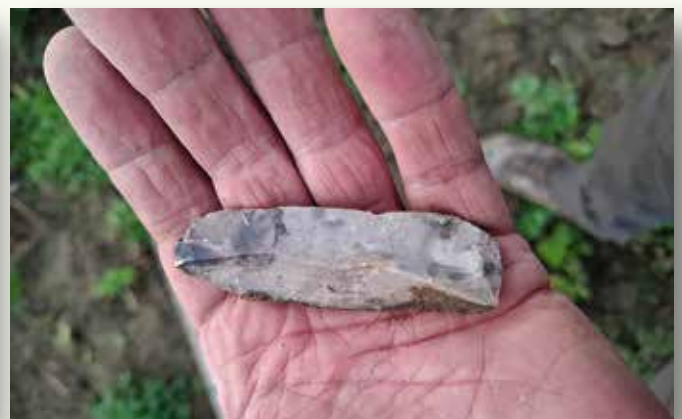
Links een 'swale': deze ondiepe greppel volgt de hoogtelijnen, wat helpt om regenwater te verzamelen, vast te houden en te laten infiltreren in de bodem. Rechts: een vuursteenkling, een van de vele neolithische vondsten die in dit gebied al gedaan werden.