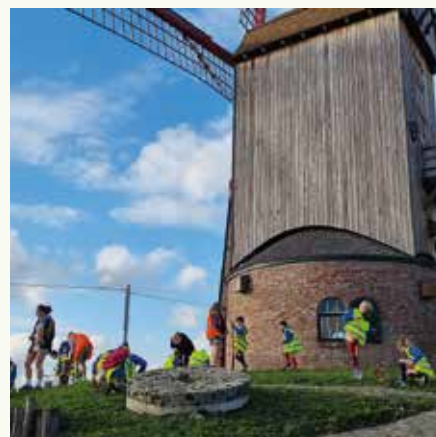
Plantactie met de Chiro bij de Wullepitmolen. Krokkussen verzekerd!

We kiezen ook bewust voor biobollen. In niet-biobollen worden nog steeds heel veel fungiciden en insecticiden aangetroffen. (Dat betekent ook dat er een behoorlijke impact is op en rond de velden waar die bollen geteeld worden. Zeker in Nederland is daar heel wat heibel rond.) De tuinier die ze plant, het bodemleven rond de bol en de bestuivers op de