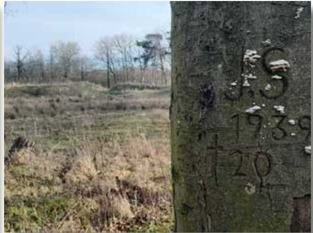
Links: gehamerde eik in Merkenveld. Schalm en hamerslag zijn duidelijk te zien, maar iets hoger zie je ook nog een Romeins cijfer, ooit geritst door een bosbeheerder. De meetklem (ofte 'cloupe') geeft de diameter van de stam aan. Rechts: een gedenkteken met initialen en jaartal op een beuk in de Kerselaardreef in Vloethemveld. Door het afsterven van de boom (uitdroging) is dit teken anno 2025 zo goed als verdwenen.

kan gemeten worden, bij wijze van evaluatie van het gevoerde beheer.