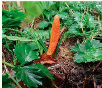
Rupsendoder ( Cordyceps militaris ): klein maar venijnig.

planten eet die met sporen van de zwam besmet zijn. Als de rups daarvan eet en zich later ingraaft om te verpoppen, groeien de sporen uit tot schimmeldraden in en om de pop. De rups sterft en uit de pop groeit een paddenstoel: onze rupsendoder. Een vleesetende zwam dus! Ook sommige keverlarven komen op deze spectaculaire manier aan hun einde. Deze paddenstoel is klein, 2 tot 6 cm, en je ziet 'm daarvoor ook makkelijk over het hoofd.