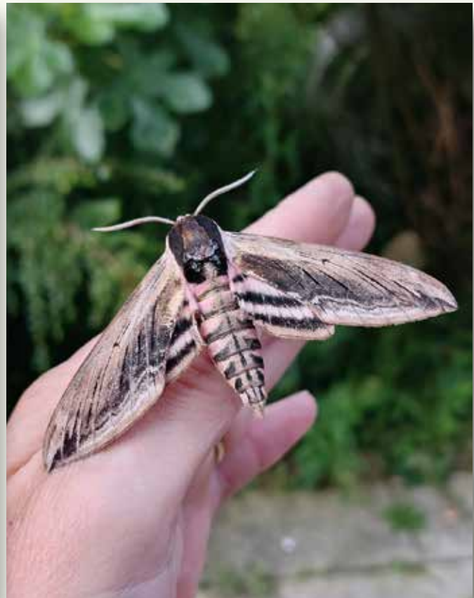
Nachtvlinders maken ruim een derde uit van het totale aantal soorten dat ik in mijn tuin kon spotten. Dit zijn een Grote beer ( Arctia caja ) en een Ligusterpijlstaart ( Sphinx ligustri ).