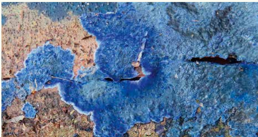
De leerlingen van het 6e leerjaar van WonderWijs.

Op 4 februari spotte Danny Deschacht een felblauwe vlek tijdens een wandeling langs de Stationsput