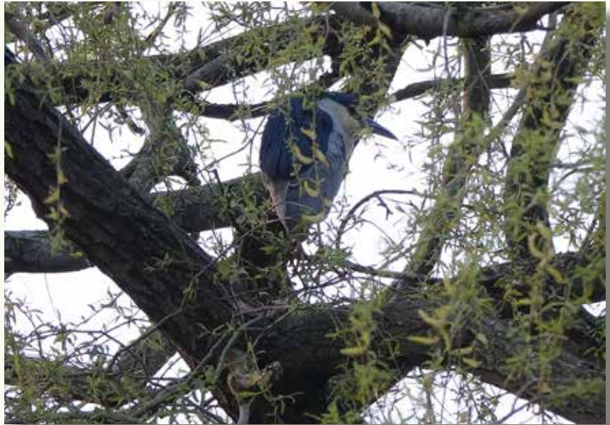
Deze kwak nam even pauze in de treurwilg van Danny Dewulf. Goed voor 'De Corveleijn' en 'Publieksprijs' 2022!

Op vrijdag 27 januari en zaterdag 28 januari trokken de leden van Natuurwerkgroep Torhout er weer op uit om op zo veel mogelijk plaatsen in Torhout de roofvogels te tellen. Ze telden 34 buizerds, 7 torenvalken, 3 sperwers, 1 slechtvalk, 1 smelleken, 1 steenuil en 1 blauwe kiekendief. Mooie aantallen van 'gewone soorten' dus en enkele 'speciallekes' om het wat te kruiden. Op naar de volgende editie!