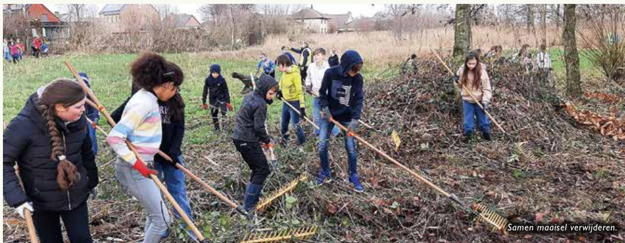
Samen maaisel verwijderen.