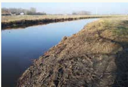
Ondertussen werd, waar mogelijk, het vervuilde riet geruimd. Normaal gezien zal dit zonder al te veel problemen teruggroeien.

De vervuilde rietkragen vormden dus zowel op korte als op lange termijn een probleem. De trek- en broedperiode komen er aan, waarbij dodaars, fuut, ijsvogel, kuifeend, oeverloper, witgat en verschillende soorten rietzangers hier vaste gasten zijn. De nesten van watervogels die plantenmateriaal gebruiken, zijn allemaal potentiële slachtoffers. Ook de speciaal ingerichte paaiplaats voor vis, bij 'De Witte Brug' in Gistel, werd bedreigd.