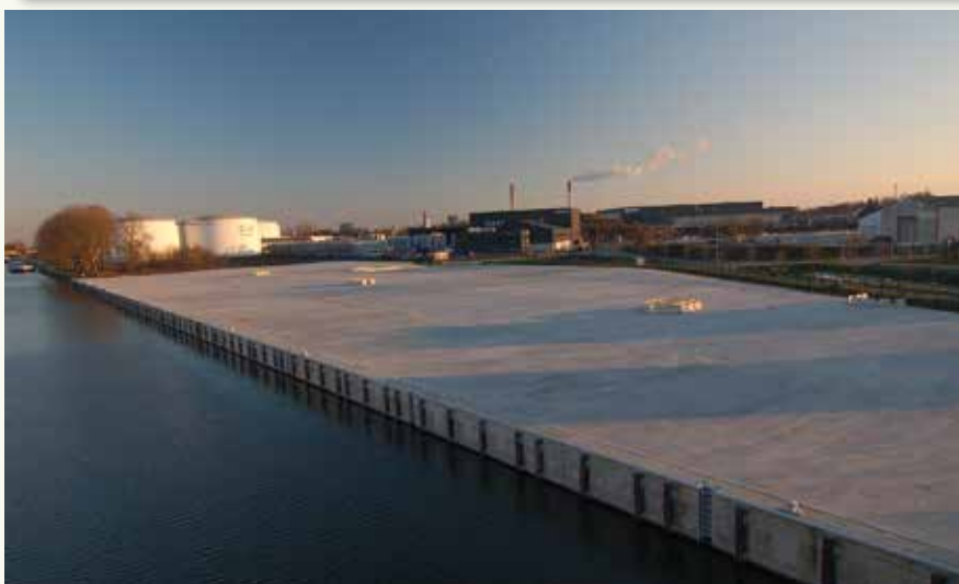
Voor de aanleg van deze ongebruikte containerterminal in het Roeselaarse havengebied werden tientallen oude platanen gekapt. Luchtfoto uit 2018 van dit gebied.

Nieuwbouw & verbouwingen Carports & bijgebouwen - Terrassen & opritten