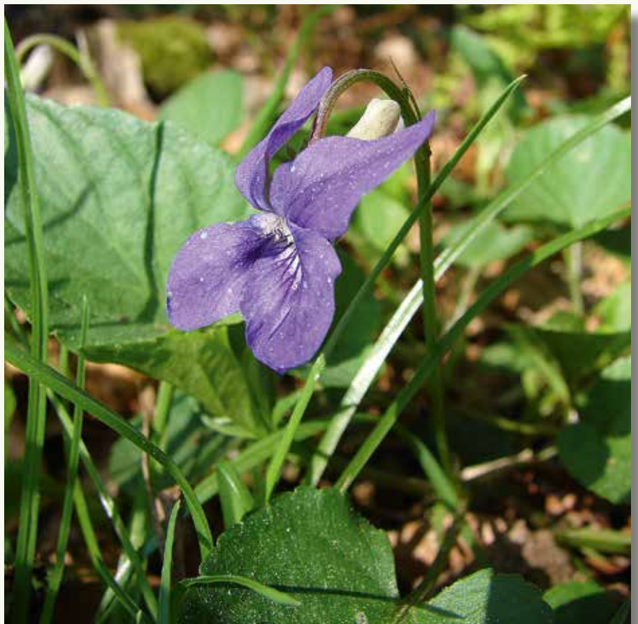
Bleeksporig bosviooltje ( Viola riviniana ) met een duidelijk bleek, bijna wit spoor, dat achter de bloem uit komt piepen.

Vijf niet vergroeide spitse kelkbladeren met een aanhangsel omvatten de vijf niet vergroeide kroonbladeren die elkaar aan de rand bedekken. De kroonbladen zijn blauw tot violet van kleur, behalve dus de spoor van het onderste kroonblad. Het effen blauwpaarse kroonblad heeft een uitvoering honingmerk van gevorkte lijntjes aan de basis. De roomwitte tot lichtblauw aangelopen spoor verdikt naar het uiteinde toe. Het woord 'stompsporig' tekent de plant in één van haar