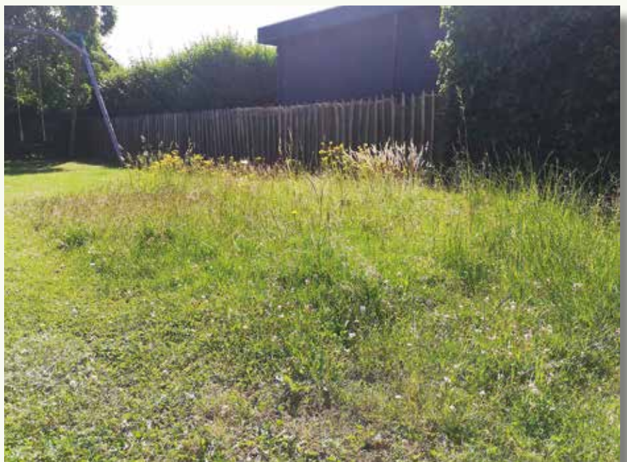
Amper 12 m 2 ongemaaid gazon leverde een kleine schat aan boeiende bloembezoekers op.

De app is gekoppeld aan www.waarnemingen.be . Als je ObsIdentify regelmatig gebruikt, maak je