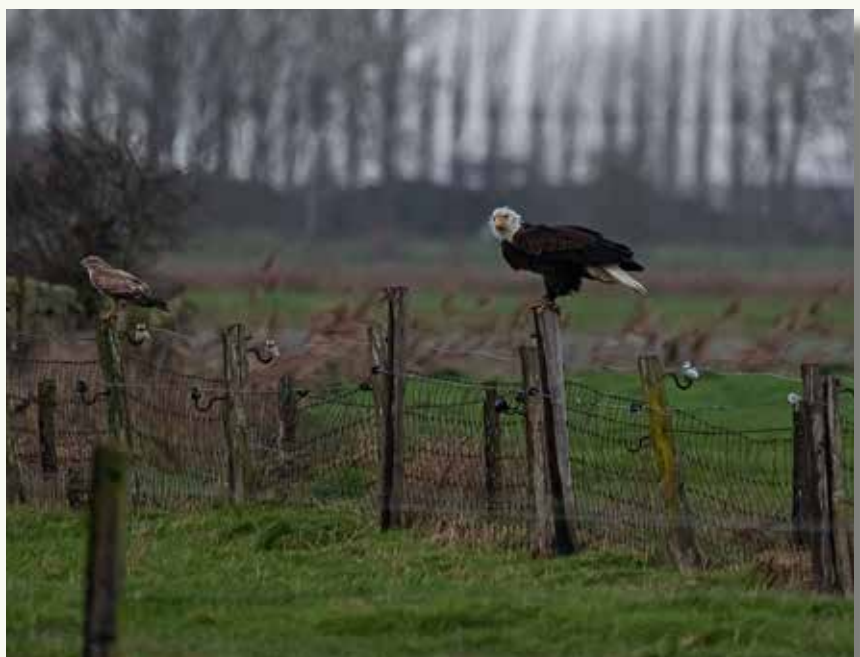
Deze kwak nam even pauze in de treurwilg van Danny Dewulf. Goed voor 'De Corveleijn' en 'Publieksprijs' 2022!

niveau hersteld. En deze vogel mag dus, mits de nodige vergunningen, door valkeniers gehouden worden. Maar zeg nu zelf: in het wild is zo'n vogel toch veel mooier?