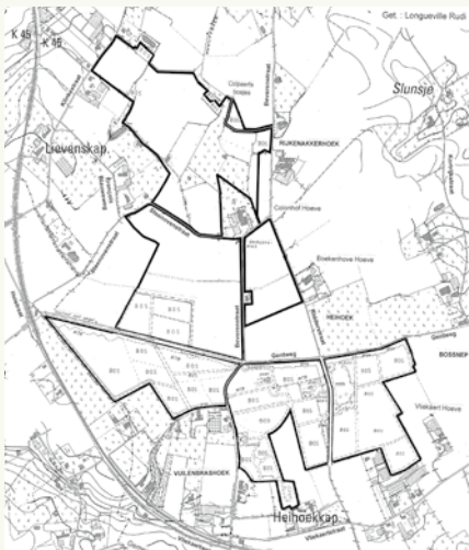
Het nieuwe bos (lichtgroen) komt ten noorden van het huidige bos (donkergroen). Kaart: ANB.

Het Agentschap voor Natuur en Bos heeft 33 hectare landbouwgrond aangekocht in Lichtervelde met de bedoeling deze te bebossen. Dit nieuwe bos zal de verbinding vormen tussen de bestaande Huwynsbossen en de Colpaertbosjes, net ten noorden daarvan. De Lichterveldse Huwynsbossen worden in één klap 2 x zo groot. Machtig.