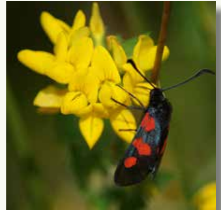
'De Swal' herbergt een mooie populatie vijf-vlek-sint-jansvlinders.

Het is misschien nog te vroeg om na drie jaar tellen al veel conclusies uit deze cijfers te trekken, maar het is toch opvallend dat de vlinders die als pop in het gras overleven het in 2022 veel beter deden dan eerdere jaren. De blauwtjes, dikkopjes en zandoojies vlogen talrijker dan tevoren. De keuze om gefaseerd te maaien en stukken niet te maaien lijkt dus vruchten af te werpen.