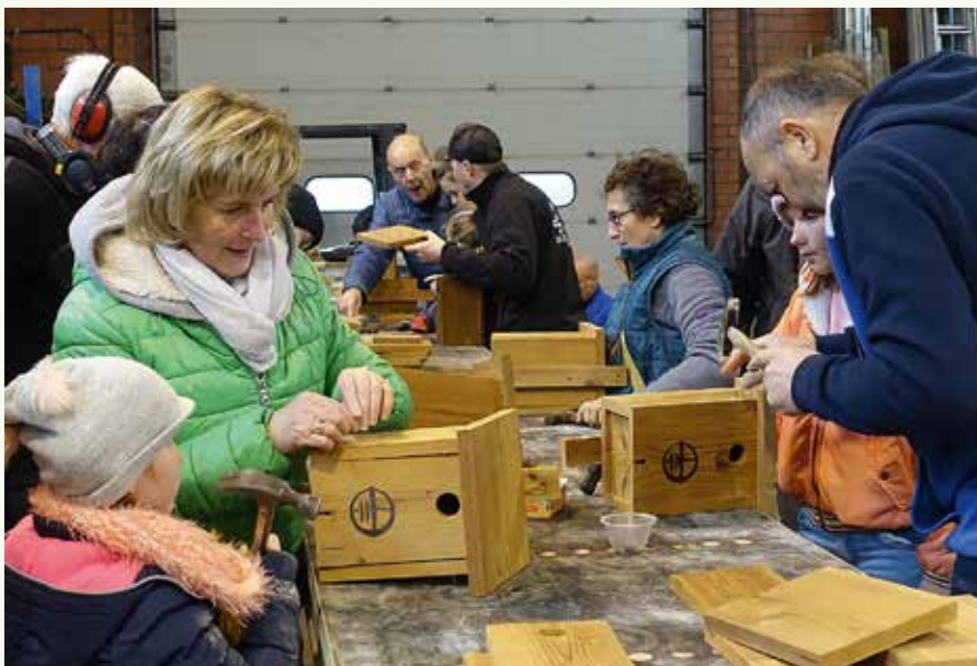
Dankzij de hulp van bijna 50 vrijwilligers van alle leeftijden was onze voorraad nestkasten in een wip weer aangevuld.

Op woensdag 28 december, de dag van de onnozele kinderen, ging de jaarlijkse timmeractie van Natuurpunt Mandelstreek door. Bijna 50 mensen kwamen mee timmeren. We mogen deze luidruchtige doe-activiteit een overdonderend succes – ook letterlijk :- ) – noemen. Idem voor de cake en verse warme chocomelk, die tot op de bodem werd geleegd. En nog een dikke dankjewel aan bouwfirma Debal, waar we al jaren welkom zijn om deze timmermiddag te organiseren.