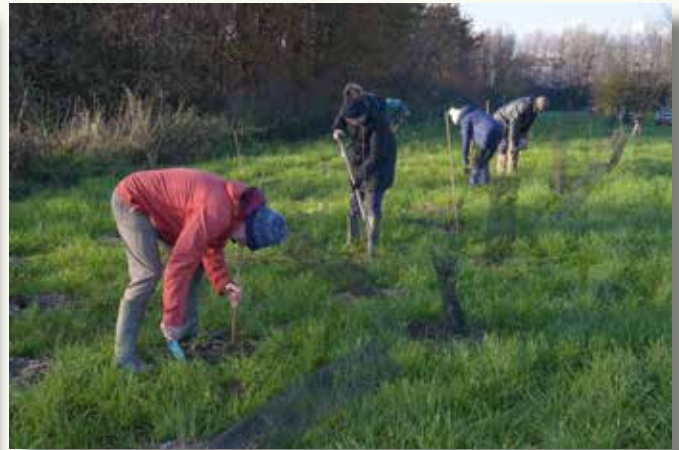
Met 36 paar handen was deze plantklus vlot geregeld. Nog een dikke dankjewel aan alle helpers.

den. Zo krikken we de biodiversiteit in de regio op.