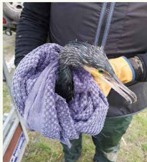
Voor de vogels links kwam alle hulp te laat, de aalscholver rechts werd naar het VOC in Oostende gebracht en is ondertussen weer de oude.

Vloethemveld, de vervuiling verder zouden verspreiden.