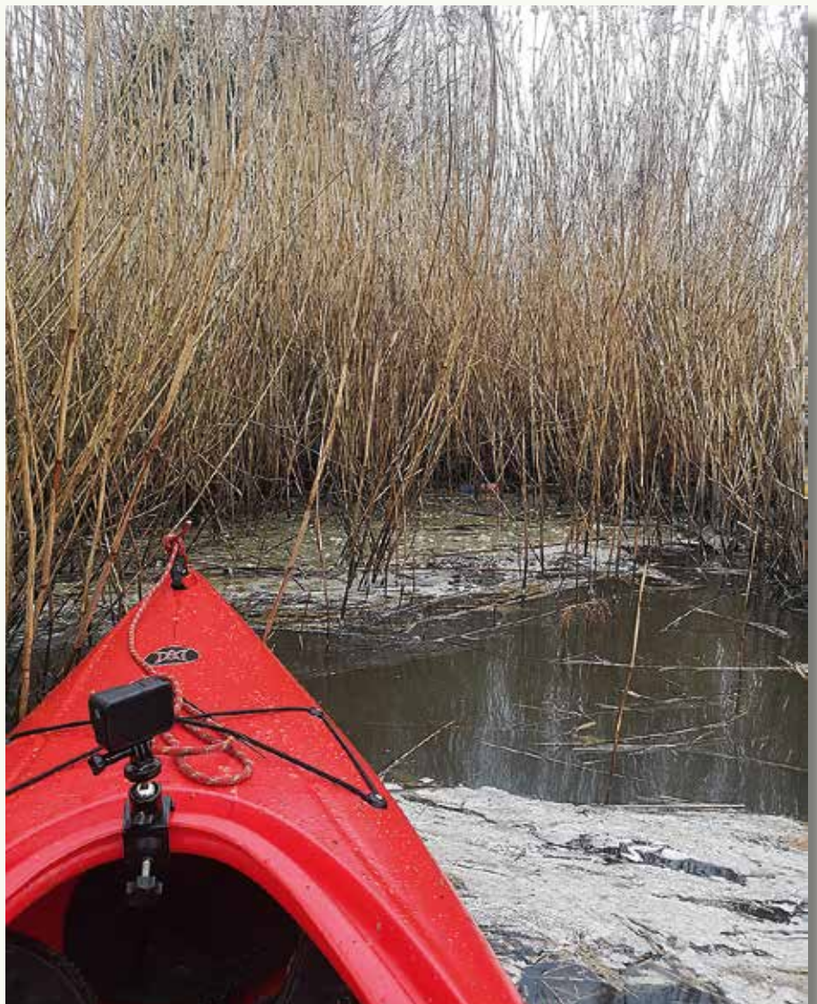
Niet alle smurrie stroomde door in de richting van het kanaal Plassendale-Nieuwpoort. De rietkragen in het gebied hielden veel vet vast, waar het een bedreiging vormde voor de aanwezige watervogels.

Van verschillende natuurfotografen kregen we ondertussen foto's binnen van onder meer besmeurde reigers en waterhoenen. Telkens deze en andere vogels het water in gingen, waren ze in gevaar. Een bedreiging voor de biodiversiteit langs deze waterlopen. We vreesden ook dat vogels die hier fourageren en in andere gebieden overnachten, zoals de aalscholvers die gaan slapen in het