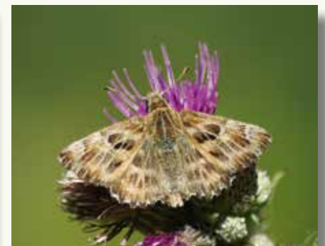
De grote parelmoervlinder en het kaasjeskruidkoppje hebben zich nog maar sinds kort in onze regio gevestigd.

In 2022 vlogen niet erg veel vlinders, maar zagen we uitzonderlijk