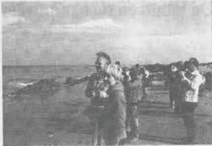
De meeste leden van de Wielewaal zijn doodgewone mensen, die alleen maar van de natuur willen genieten, zonder daarom specialist te zijn...

De Mandelstreek is een 4-politieke ornithologische vereniging. Toch vecht de Wielewaal mee wanneer het gaat om echte natuurbescherming. Denken we in dit verhaal even aan de inzet van de vereniging voor het be-