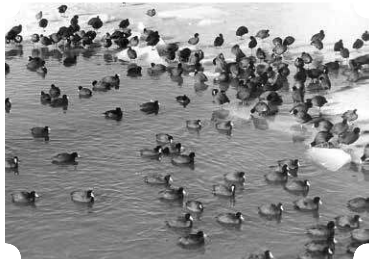
Meerkoeten die een wak openhouden tijdens de moeder van alle winters in 1963. Allemaal meerkoeten? Cherchez la femme, of misschien ook een echte eend in de bijt...

Diezelfde ambitie koesterden we ook toen we halverwege vorig jaar de fotowedstrijd gelanceerd hebben: een tijdsbeeld van natuur anno 2013-2014 in ons werkingsgebied krijgen. Nu met krachtiger camera's, lichtsterkere lenzen en digitaal verwerkt. Maar wie achter de zoeker staat en voor de lens komt blijft onveranderd belangrijkst!