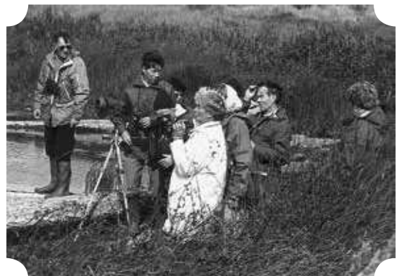
Excursie bij de Kooiplas in Schiermonnikoog, augustus 1989