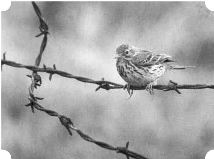
Graspieper, mei 1966 in de broeken van het IJzerbekken. Hoewel 'gras'pieper, hebben ze een voorliefde om op prikkeldraden post te vatten. In die tijd waren graspiepers een zeer gewone broedvogelsoort, die ook in de directe omgeving van Mandelstreek algemeen voorkwamen, net als veldleeuweriken. Opvallend voor beide soorten grondbroeders is de zeer lange nagel aan de achterteen.

Hierdoor kwamen gebieden als de IJzermonding en het Zwin, beide een steltloperseldorado, binnen bereik. De chauffeurs moesten noodgedwongen delen in het enthousiasme van de jonge vorsers. Zo kwam het dat Adhemar van het familieportretteren met een kleine telelens de overstap maakte om vogels in het vizier te krijgen. Wat begon als een voorzichtige oefening werd al gauw een niet te stuiten passie. Adhemar en zijn reflexcamera werden onafscheidelijk. Daar kreeg men lucht van in Turnhout, waar de redactie van het ledenblad De Wielewaal ook zetelde. Honderden van zijn zwart-wit snapshots kregen een plaats in het tijdschrift. Vaak unieke beelden.