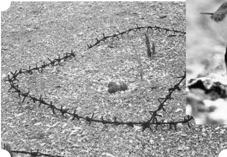
De laatste strandplevier van Oostduinkerke verdedigen hun legsel tegen het opdringerig toerisme door deze tussen verroeste pinneken draad te leggen. Juni 1969