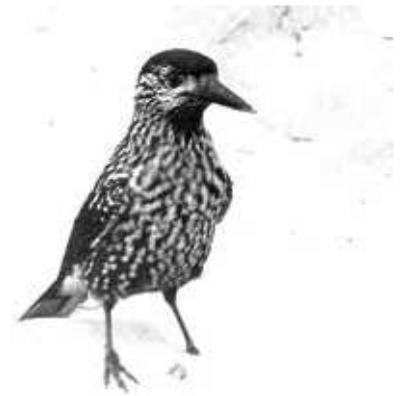
Een ongewoon beeld van een Siberische notenkraker aan onze kustduinen in 1968. Dat jaar maakten we een massale invasie mee van die oostelijke soort naar ons land, waarbij het zelfs tot enkele broedgevallen kwam. Notenkrakers zijn erg afhankelijk van de zaadproductie bij naaldbomen. Bij schaarste zakken ze af naar West-Europa.