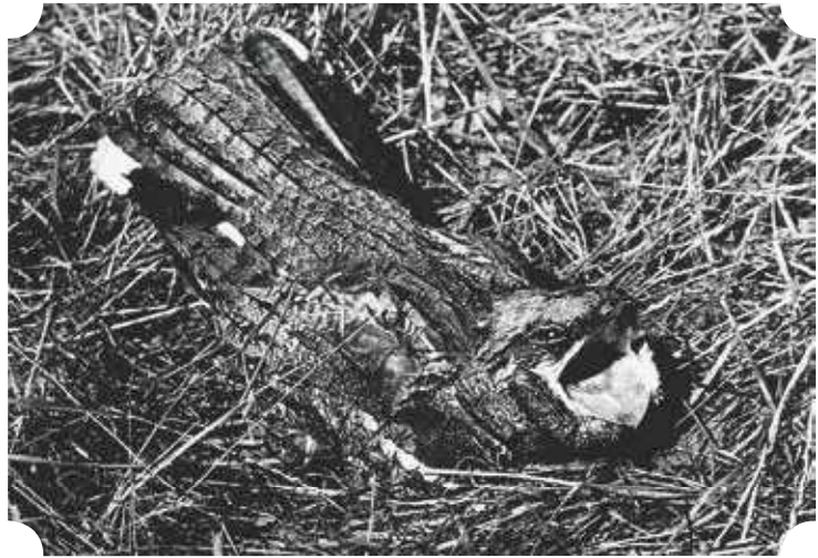
Dreighouding van een nachtzwaluw op nest, die begin jaren 60 ten zuiden van Brugge regelmatig tot broeden kwamen. De wagenwijde bek diende op de eerste plaats als passend vangnet voor nachtvlinders en grote kevers.

Het gebeurde al eens vaker dat de toen vrij algemene gekraagde roodstaarten de nabijheid van bewoning opzochten om te broeden. Brievenbussen boden een veilig onderkomen, tenminste als de dagelijkse post er niet meer in terecht kwam. Gelukkig hebben postbodes ook een groot aanpassingsvermogen... Kiekje bij de burens van Adhemar Lagrou in 1974