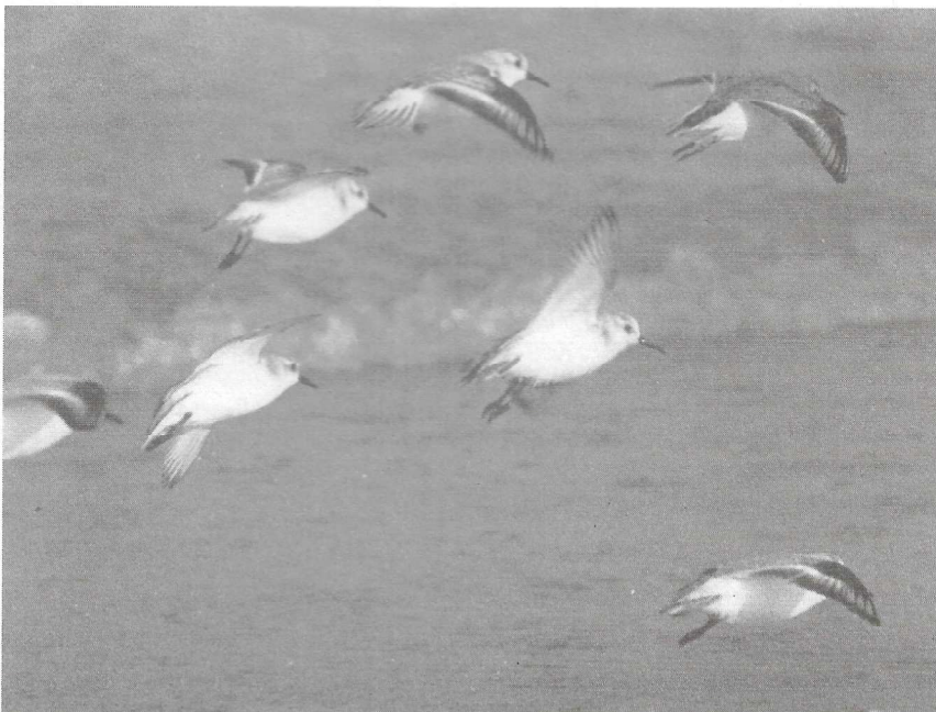
Vlucht drieteentjes, Adhemars favoriete strandlopersoort.