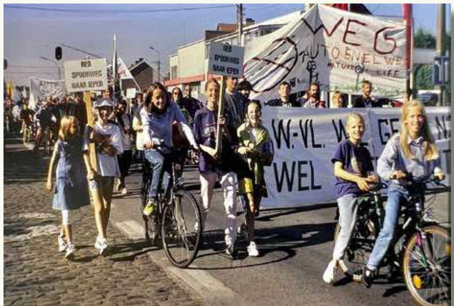
Betoging op 21 september 1997 tegen de N37, die bovenop de Stroroute aangelegd zou worden.

correct beheer van de stortplaats. Bewoners uit de ruime omgeving stoorden zich bovendien aan de geurhinder en de zware transporten tot 's avonds laat. De inkt vloeide weer met beken bij onze actiegroep, maar stilaan groeide ook het besef dat we sterker zouden staan als we als belanghebbende rechtspersoon konden optreden.