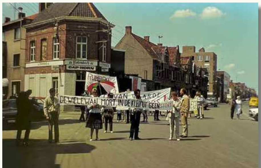
Tweede betoging tegen het stort in de Kleiputten, op 15 juni 1985.

Een fondsenwerving, met onder meer de succesvolle stickerverkoop 'Geen stort in de Kleiputten', leverde de nodige middelen om publieke acties te ondernemen en desnoods juridische stappen te zetten. Na een persmoment kwamen op 26 november 1983 ruim 1.000 bezorgde burgers op straat in Roeselare. Het