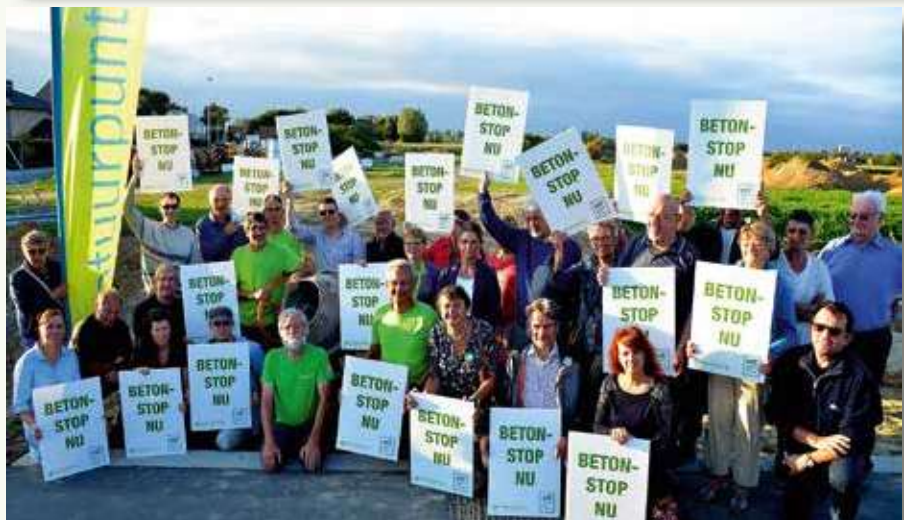
Links een interview met Focus-WTV naar aanleiding van de dreigende verkaveling van een deel van het Bergmolensbos (2016), rechts een protestactie tegen de voortschrijdende betonnering en verkaveling van het openruimtegebied rond Roeselare (2018).

PS: Vond je dit interessant? Dan hebben we voor jou nog wat activiteiten in de pijplijn zitten: