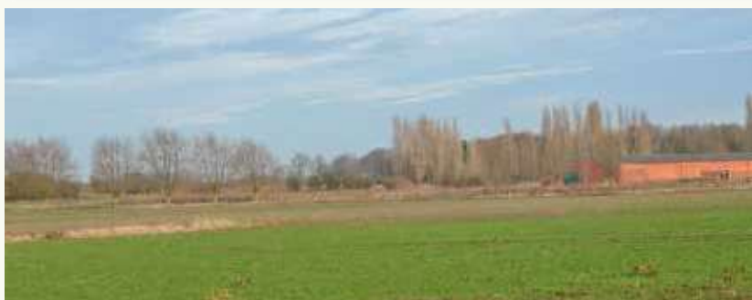
Foto boven: Een 'geel plakkaat' in volle zomervakantie. Altijd verdacht. :-)