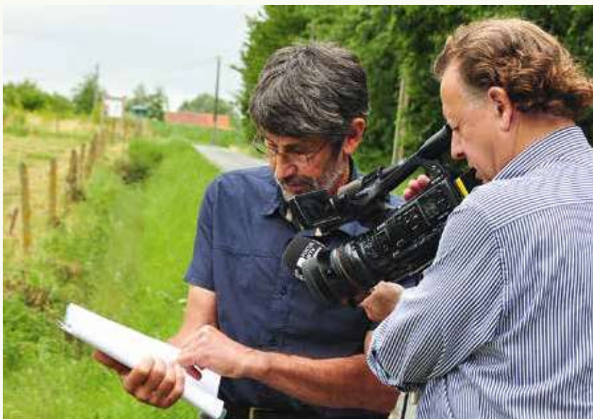
Ons protest werd ongelooflijk snel opgepikt door de media. Ook Focus-WTV kwam langs.

Voor iedereen, en niet in het minst voor de pasgeborenen die nog een lange toekomst wacht, wordt binnenkort weer een plantdag georganiseerd. Dan gaat er weer een geboortebos de grond in op pas aangekochte gronden. Afspraak op zondag 29 januari om 10.00 u. (Alle info op p. 19 van deze 'knotwilg'). Zo