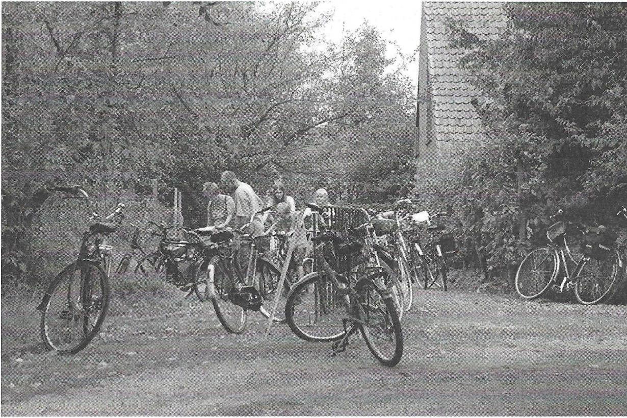
Veel (milieu-)vriendelijk volk!